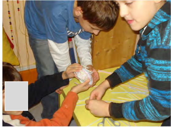
Die fertigen Werke...